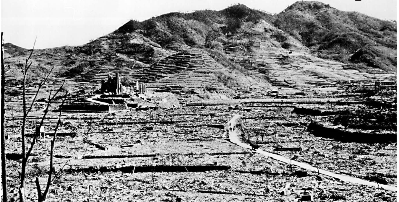
Nagasaki ist dem Erdboden gleichgemacht. Nur die Trümmern einer Kathedrale ragen noch aus der Steinwüste.

Hiroshima und Nagasaki mahnen! Atomwaffen abschaffen! Bei uns anfangen!